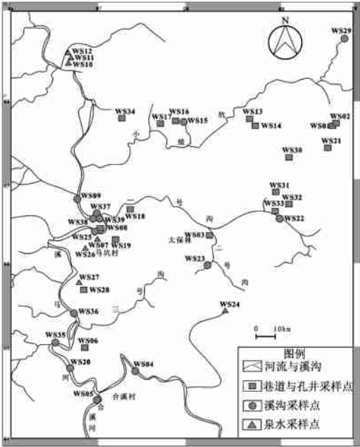
图 马坑矿区采样点分布图

® ç û £ ï -3 ^ c μ³ Ö"( ¥¹ / £ Ð ¶ c ð ¥ Z M Ö ÷ ù T " ¥² T Û " â @ H W ¥ ü É „ â @ o â ¥ 9 F £ ï ¥ -3 c ï v 9 F -3, 9 ' g ï v 6 Ú # $ b y N ç û £ ï -3, 9 ' ¹ ; : 7- 9 Ú -3 c ü A Ú ¿ # £ ï ¥ c b 6 " ' A U ; ¹ î ê ™¹ / £ P : 7- 6 Ú œ -3, 9 ' • Y, v # $ V • " Ä ¥ L " s 9 V α ž £ b Â Ø | £ " Ä : 7- s È Ú œ -3, 9 ' • ° μ Ü - % s ? C ¾ | " Ä s ¹ V † £ • Y ø x £ " ï M Ö 0 c È Ú œ -3, 9 • Y | b y N -3, 9 ' ? z Q ~ û • £ ¥ ? - â @ H q † " ! ¹ Ä • Y ^ û • £ " d ù î Ø X ¥ ? - U 6 4 # $ b